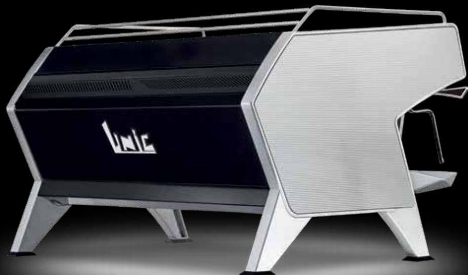
STELLA EPIC Premium côtés inox ondulé STELLA EPIC Premium with corrugated stainless-steel sides