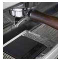
Balance intégrée Lunar Acaia Built-in drip tray integrated Lunar Acaia scale