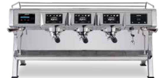
STELLA EPIC 3