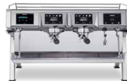
STELLA EPIC 2