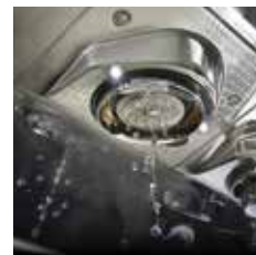
Douchettes et filtres de haute précision Precision coffee filters and shower screens