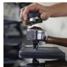
Répartiteur de mouture Coffee leveling