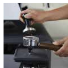
Tasseur UNIC Ø57 Coffee tamper Ø57