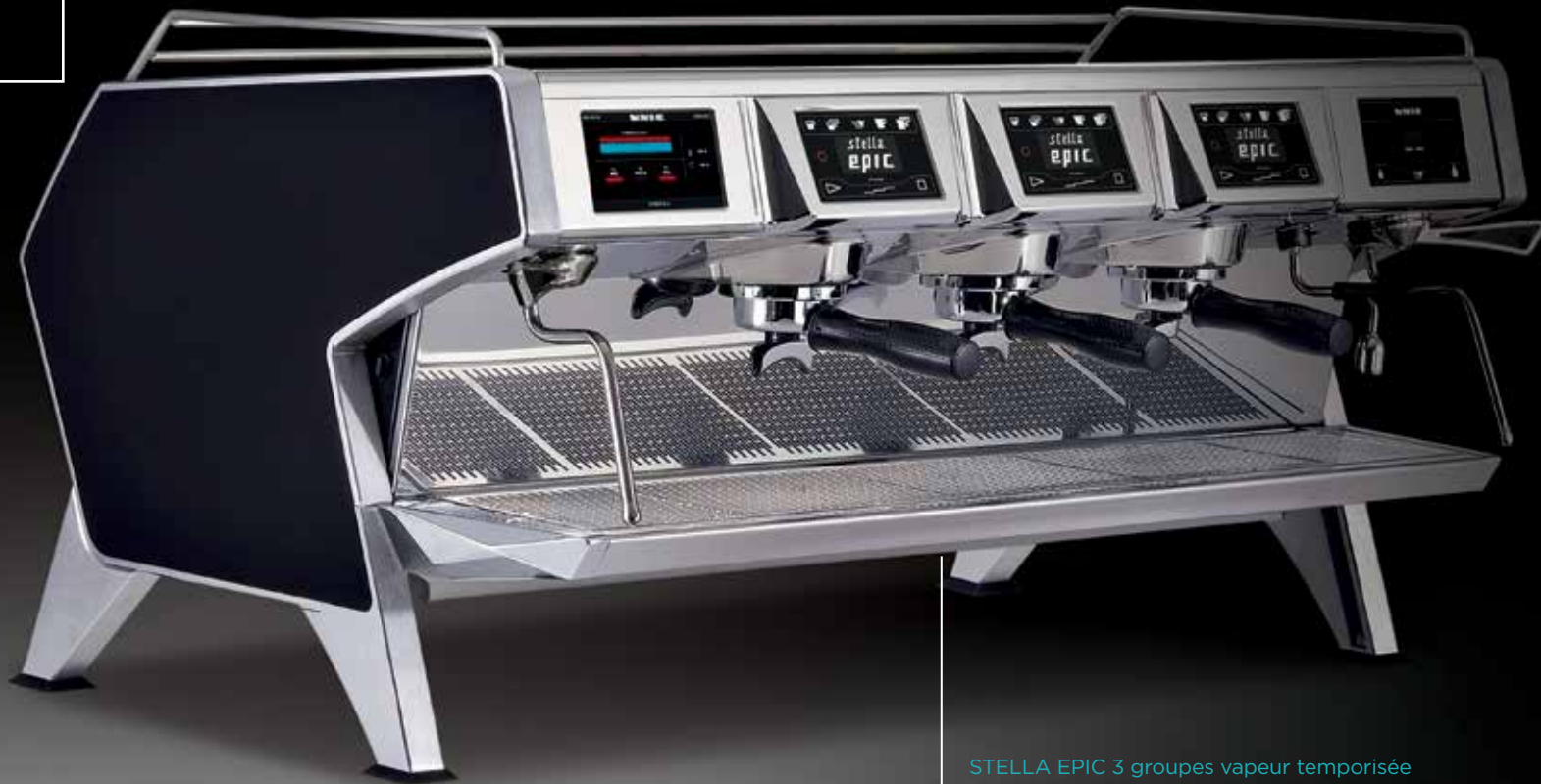
STELLA EPIC 3 groupes vapeur temporisée STELLA EPIC 3 groups with programmable steam dispenser