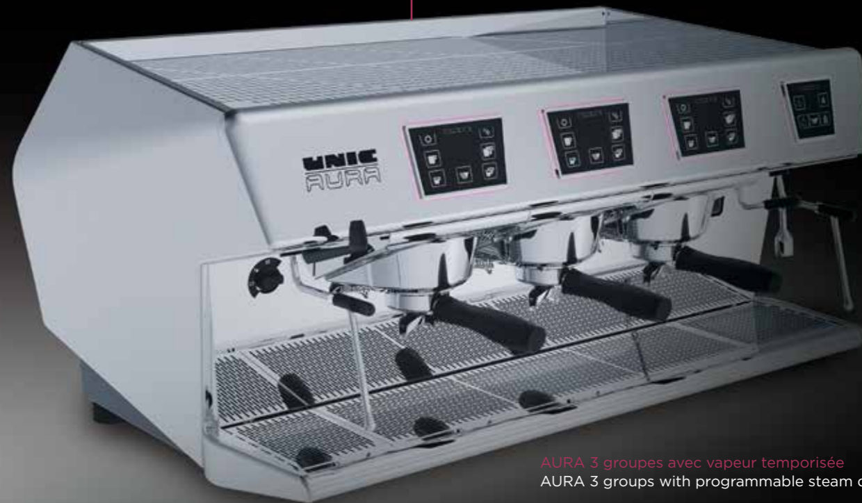
AURA 3 groupes avec vapeur temporisée AURA 3 groups with programmable steam dispenser